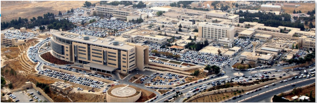
الشَّكْلُ (٣-١٠): مَدِينَةُ الْحُسَيْنِ الطَّبَّيَّةِ.

أَصْبَحَتِ الْمَمْلَكَةُ الْأُرْدُنِيَّةُ الْهَاشِمِيَّةُ مَقْصِدًا لِلسِّيَاحَةِ الْعِلَاجِيَّةِ، فَاسْتَقْبَلَتِ الْعَرَبَ لِتَلْقَى الْعِلَاجَ، وَأَصْبَحَتْ مِثَالًا لِتَفُوقِ الْخِدْمَاتِ الصَّحِّيَّةِ وَالصَّنَاعَاتِ الدَّوَائِيَّةِ.