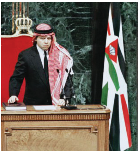
الشَّكْلُ (٣-١١): جَلَالَةُ الْمَلِكِ عَبْدِ اللَّهِ الثَّانِي

كَيْفَ تَنَعَكِسُ السِّيَاحَةُ الْعِلَاجِيَّةُ إِجَابًا عَلَى اِقْتِصَادِ الدَّوْلَةِ؟