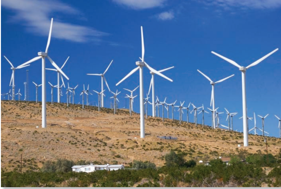
الشَّكْلُ (٣-١٢): أَحَدُ مَشَارِيعِ طَاقَةِ الرِّيحِ.

وَلِأَنَّ تَوْفِيرَ مَصَادِرِ الطَّاقَةِ أَحَدُ التَّحَدِّيَاتِ الَّتِي تُوَجِّهُ الْقِطَاعَاتِ جَمِيعَهَا، فَقَدْ وَجَّهَ جَلَالَةُ الْمَلِكِ عَبْدِ اللَّهِ الثَّانِي ابْنِ الْحُسَيْنِ الْجِهَاتِ الْمُخْتَصَّةَ إِلَى ضَرُورَةِ التَّوَسُّعِ فِي مَشَارِيعِ الطَّاقَةِ الْبَدِيلَةِ، فَأُنشِئَتْ مَشَارِيعُ الطَّاقَةِ الشَّمْسِيَّةِ وَمَشَارِيعُ طَاقَةِ الرِّيحِ؛ لِمُوَاجَهَةِ الْعُجْزِ فِي مَصَادِرِ الطَّاقَةِ التَّقْلِيدِيَّةِ مِثْلِ النِّفْطِ.