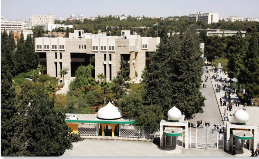
الشَّكْل (٣-٩): الجامعَةُ الأُرْدُنِّيَّةُ.

المُورِد الحَقِيقِي هُو المُواطِن الأُرْدُنِّي ، فَأَوْلَتْهُ جُلَّ اِهْتِمَامِهَا لِتَطْوِير الخِدْمَاتِ التَّعْلِيمِيَّةِ ، وَنَشَرَ المَدَارِسِ فِي مُخْتَلَفِ مَنَاطِقِ المَمْلَكَةِ ، وَتَوَجَّ ذلكَ فِي عَهْدِ المَلِكِ طَلالِ -طَيَّبَ اللهُ ثَرَاهُ- بِجَعْلِ التَّعْلِيمِ إِزَامِيًّا وَمَجَانِيًّا ، وَيُعَدُّ هَذَا القَرَارُ